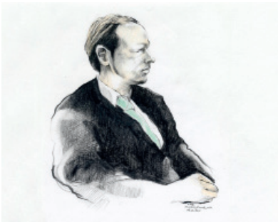
Anders Behring Breivik hadde kalkulert hvordan han ville fremstå, men straks fengslingsmøtet var i gang begynte fasaden å slå sprekker.