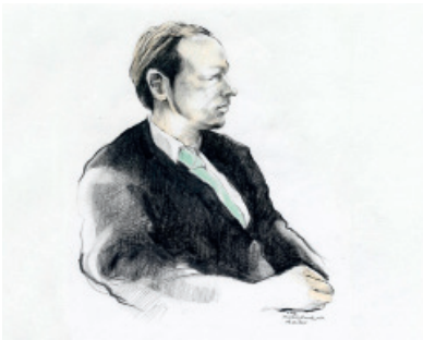
Anders Behring Breivik hadde kalkulert hvordan han ville fremstå, men straks fengslingsmøtet var i gang begynte fasaden å slå sprekker.